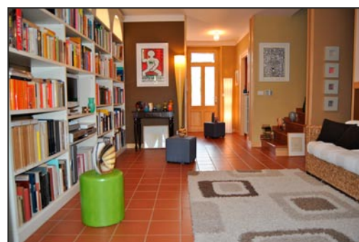
L'Arengario S.B. - interno della casa