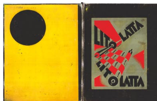
Uno dei libri in mostra: L'anguria lirica di Tullio d'Albisola (1934) illustrazioni di Bruno Munari